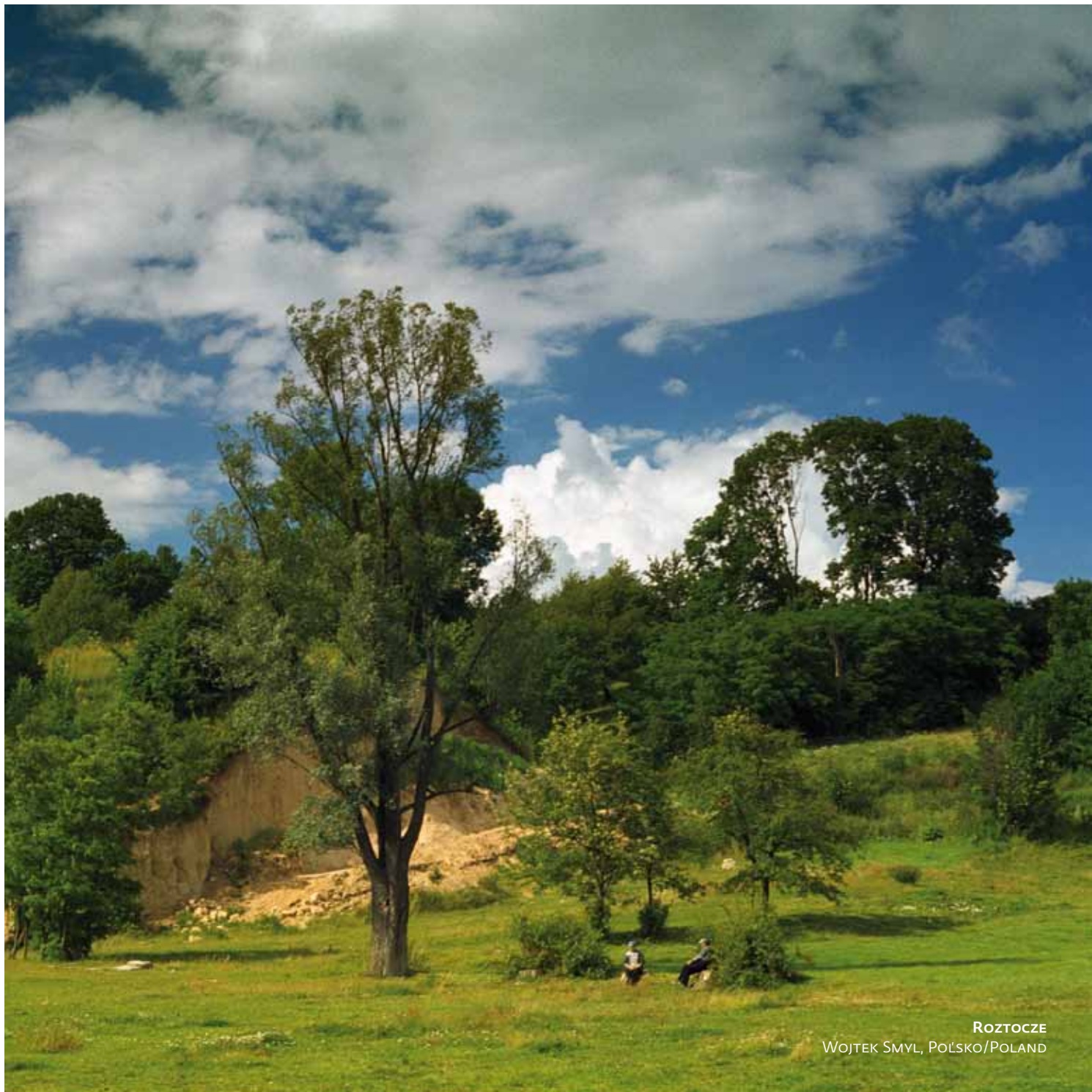
ROZTOCZE WOJTEK SMYL, POŁSKO/POLAND