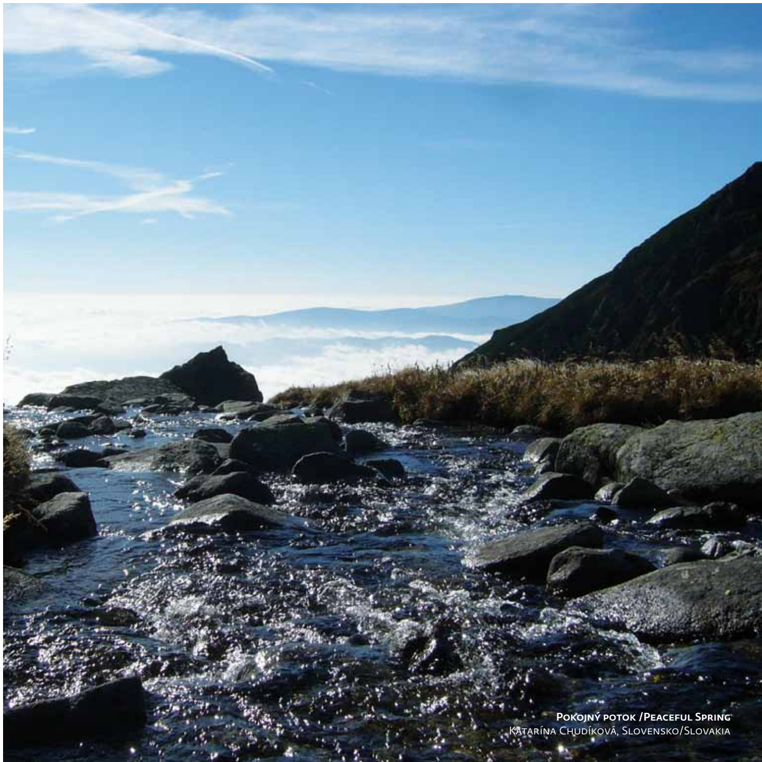
POKOJNÝ POTOK / PEACEFUL SPRING KATARÍNA CHUDÍKOVÁ, SLOVENSKO/SLOVAKIA