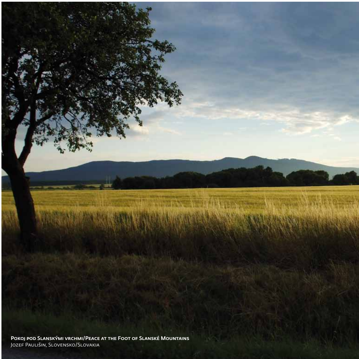
POKOJ POD SLANSKÝMI VRCHMI/PEACE AT THE FOOT OF SLANSKÉ MOUNTAINS JOZEF PAULIŠIN, SLOVENSKO/SLOVAKIA