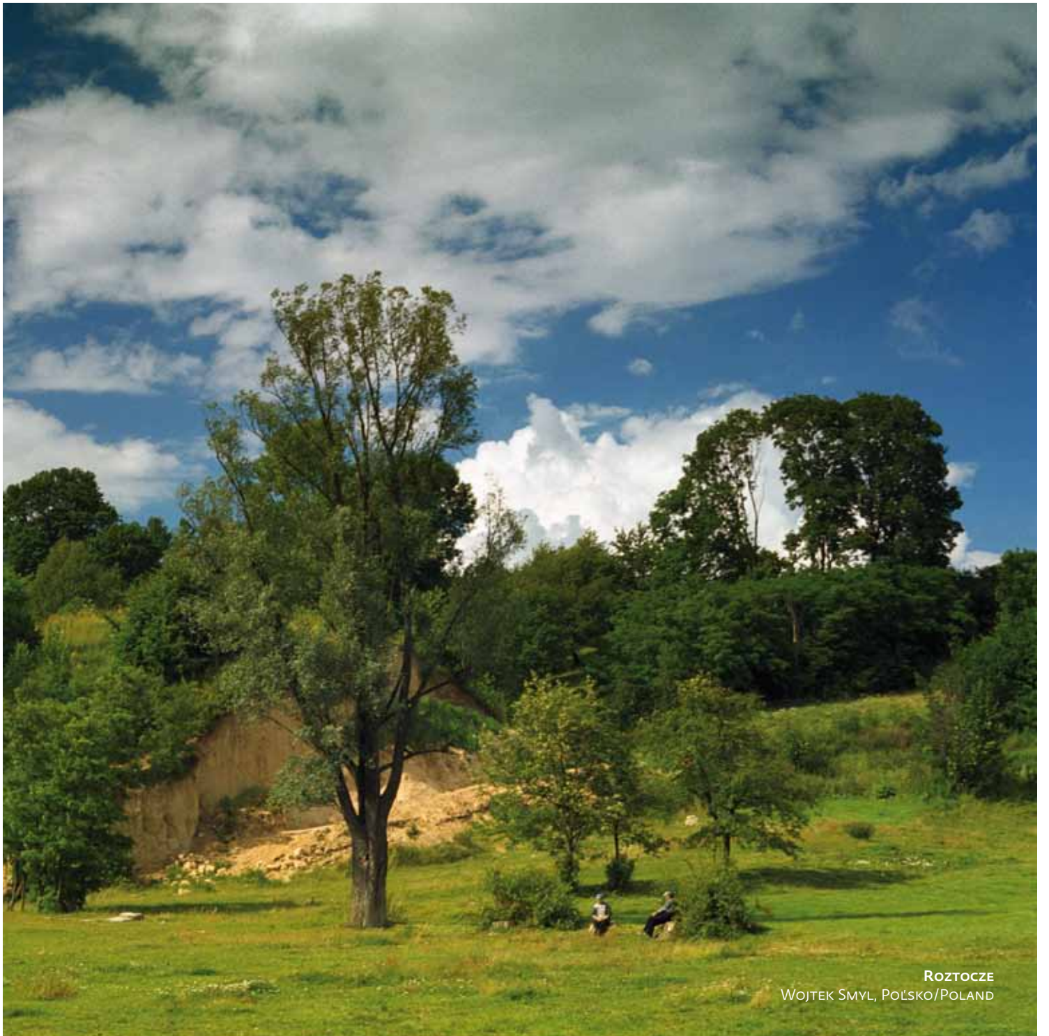
ROZTOCZE WOJTEK SMYL, POŁSKO/POLAND